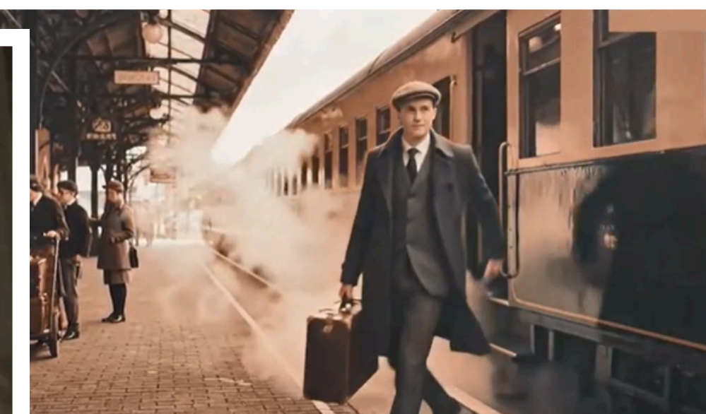
Trechos de vídeos que fizeram parte da apresentação, contando a história de Canguera.