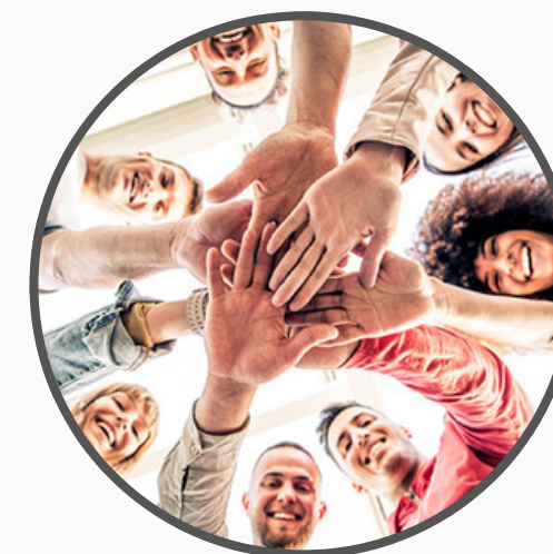
Novos projetos sócio-culturais