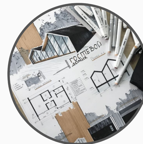
Construção da nova Sede

Nossos objetivos são grandes para os próximos anos, como a construção da nova sede do IQS e o desenvolvimento de novos projetos sócio culturais!